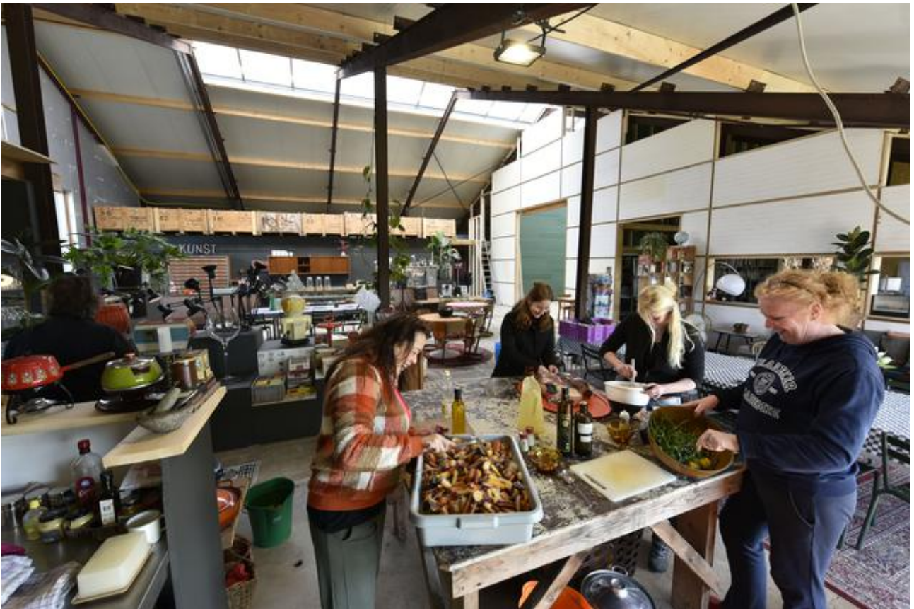
Vorbereidingen voor de opening vrijdagmiddag.